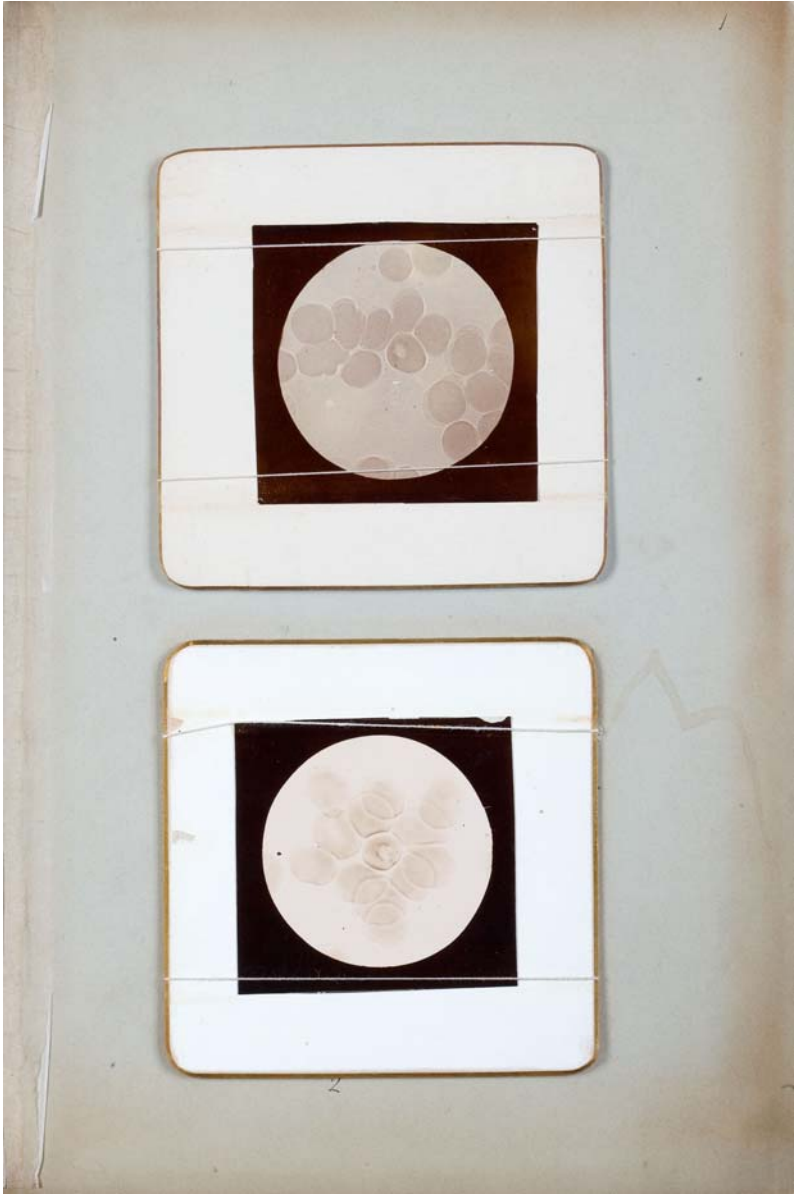
Camillo Golgi (Kat.-Nr. 32)